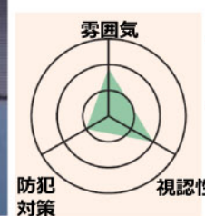
ポーチライト+門柱灯+アプローチスタンド