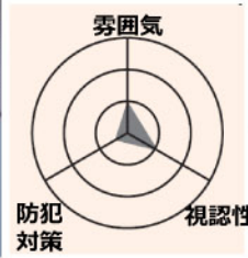
ポーチライト+門柱灯