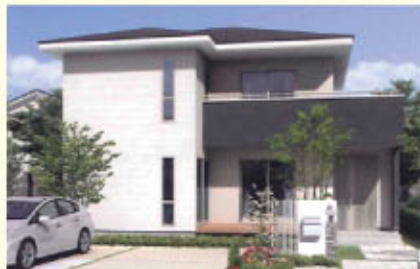
【シンプルモダンスタイル】