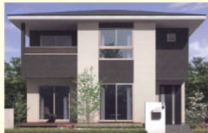
【ジャパニーズモダンスタイル】