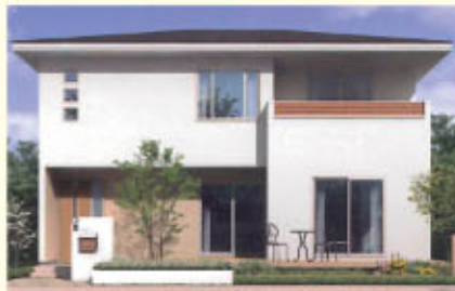
【ナチュラルモダンスタイル】