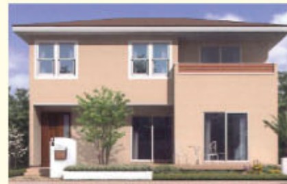
【プロヴァンススタイル】